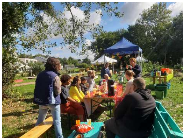
Fête de l'été au Jardin du Russeo

L'hiver ça se fête : Au jardin d'Almaty - Quartier Maurepas Gayeulles – Rennes – 21 décembre