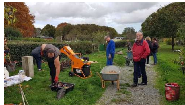
Rennes Jardins familiaux de la Bintinais