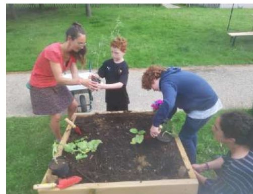
Plantation de legume d'été Jardin d'Odette Maurepas