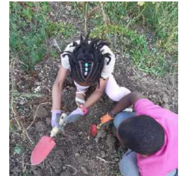
Ramassage des pommes de terre avec les enfants au Jardin des Lavandes