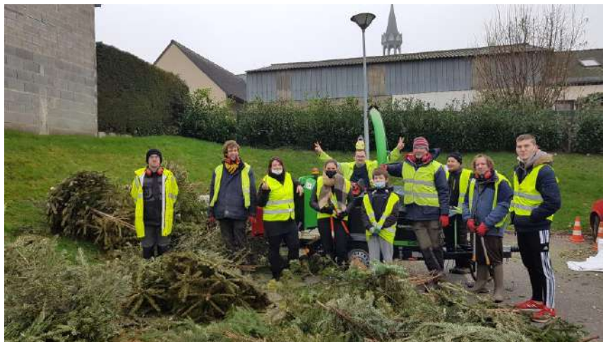
Bourgbarré, le 15/01/22

Les opérations sont réparties par communes pour proposer aux habitants de Rennes Métropole un lieu de proximité (enclos à sapins) pour déposer leur sapin après les fêtes.