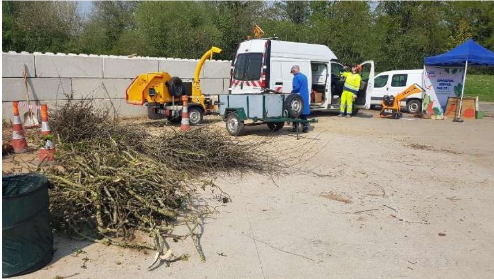
Betton, le 20/04/22, Déchetterie