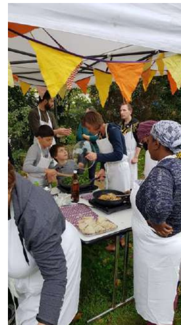
-> Atelier Jardin Solidaire le blosne

> 13 octobre : 10 participants sont venus cuisiner et 13 ont assisté au repas