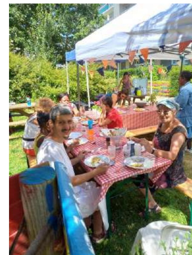
Atelier Jardin des Noisettes Villejean

82 personnes au total ont bénéficié de nos actions : 70 sont issues des quartiers prioritaires et \frac{3}{4} sont des femmes.