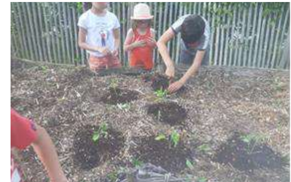
Plantation de poivrons Jardin du Conseil Municipal des Jeunes - Chantepie