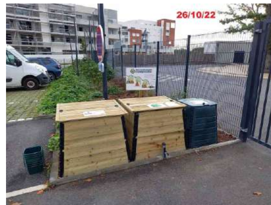
Aire de compostage de l'école du petit prince à Noyal-Châtillon-sur-Seiche.