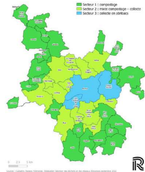
TRI À LA SOURCE DES BIODÉCHETS Secteurs du schéma 2023-2030

Les interventions de Vert le Jardin sont définies sur 3 secteurs pour l'installation de composteurs. Une nouvelle méthodologie est mise en place afin d'aller informer, sensibiliser, mobiliser d'avantage de personnes référentes et participantes.