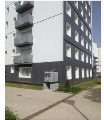
Récupérateurs d'eau destinés au jardin Chal'heureux à Maurepas