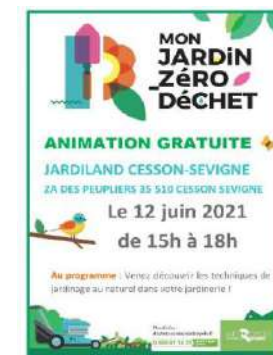
Animations en jardinerie à Cesson-Sévigné et Rennes