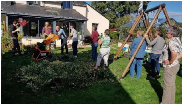
Cesson-Sévigné Chez M et Mme Gentil

14 visites de jardin ont été réalisées en 2022, mobilisant 143 habitants