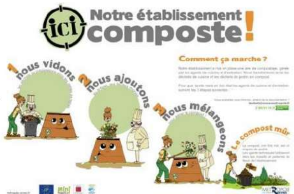
Panneau explicatif installé sur les aires de compost de restauration collective

Nous avons également poursuivi l'accompagnement d'un site déjà installé l'année précédente : la cantine scolaire de l'Hermitage.