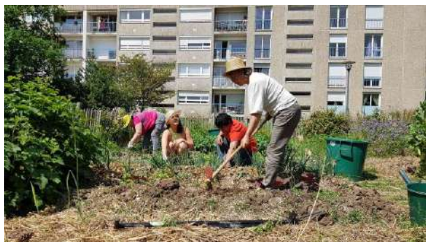
Préparation d'une parcelle Jardin solidaire Le Blosne

-> Plantations de 2 vergers parc du landry et Parc de la Guérinais (19 novembre) et 1 plantation d’une micro forêt zac Armorique (22 janvier)