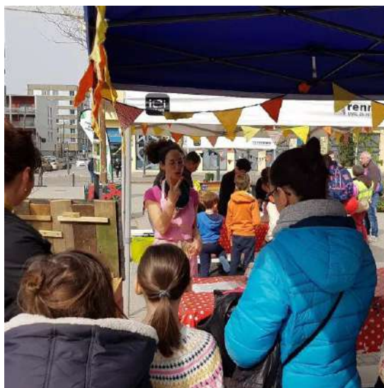
Fête du printemps au quartier Courrouze