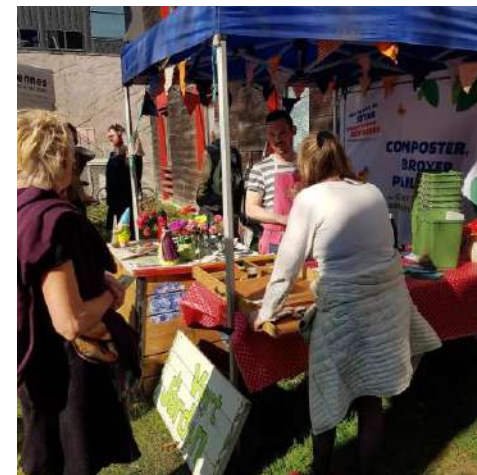
Fête des jardiniers animation compost MCE 26 mars