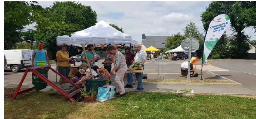
Animations de stand à Cesson-Sévigné (Délice de plantes) et à Laillé (Chemin(s) faisons)