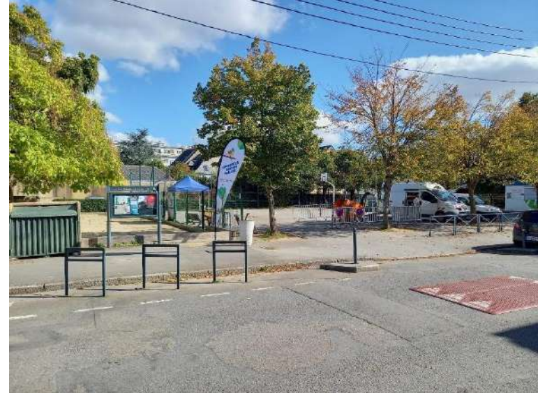
Rennes, le 08/10/22, Placette Odette Seveur