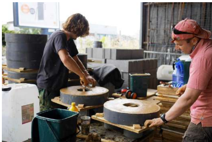
Chantier Bénévole pour la réalisation des briques en terre.

Ces aménagements, notamment dans la conception du kiosque et l'aménagement de la mare, se sont inscrits dans une réflexion plus globale sur l'aménagement et la mutualisation de l'espace du jardin et son ouverture sur le quartier, en partenariat avec la Ville de Rennes, Comme un établi, l'atelier Fezi et Territoires.