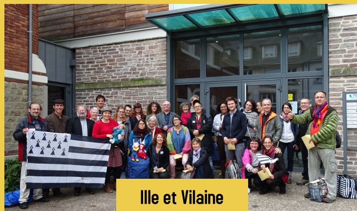
Ille et Vilaine